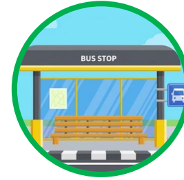
EQUIPAMENTOS E MOBILIÁRIO URBANO