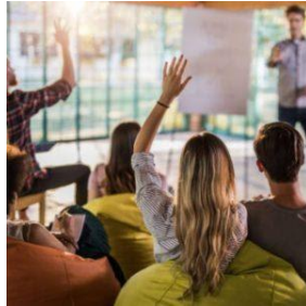
Ações de Formação Temáticas