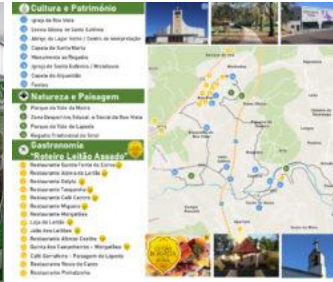
Roteiro e Flyer turístico