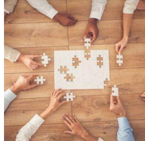
Sessões de Participação Pública