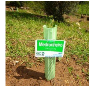
Placas de identificação de nativas